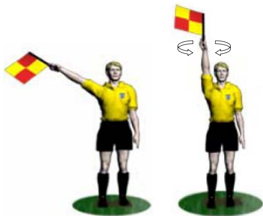
Puolustajan syyllistyessä rikkeeseen lippu nostetaan ylös oikealla kädellä.