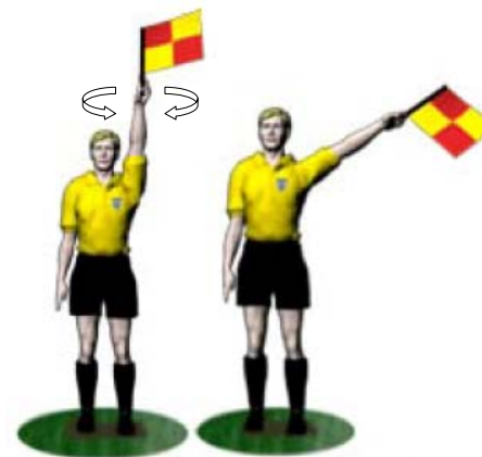
Hyökkääjän syyllistyessä rikkeeseen lippu nostetaan ylös vasemmalla kädellä.